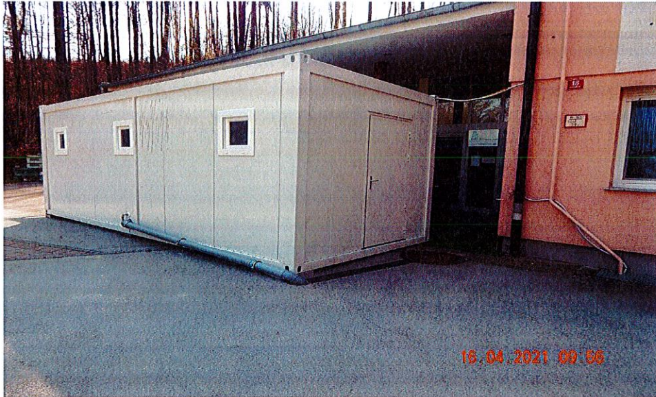
Slika 3 – mobilna enota na Gumnišču

2. mobilna filtrska enota (6m x 2 m), ki je namenjena za organizacijo filtrske cone za zaposlene v dislocirani enoti – Dom Škofljica, na Gumnišču.